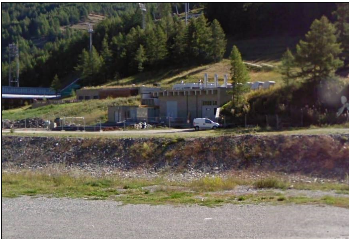
Postazione 3 presso centrale di cogenerazione