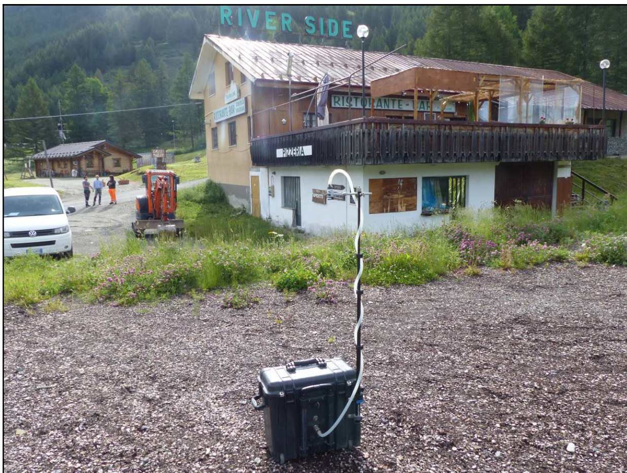
Postazione 2 presso ristorante pizzeria River Side in via Rorhbach