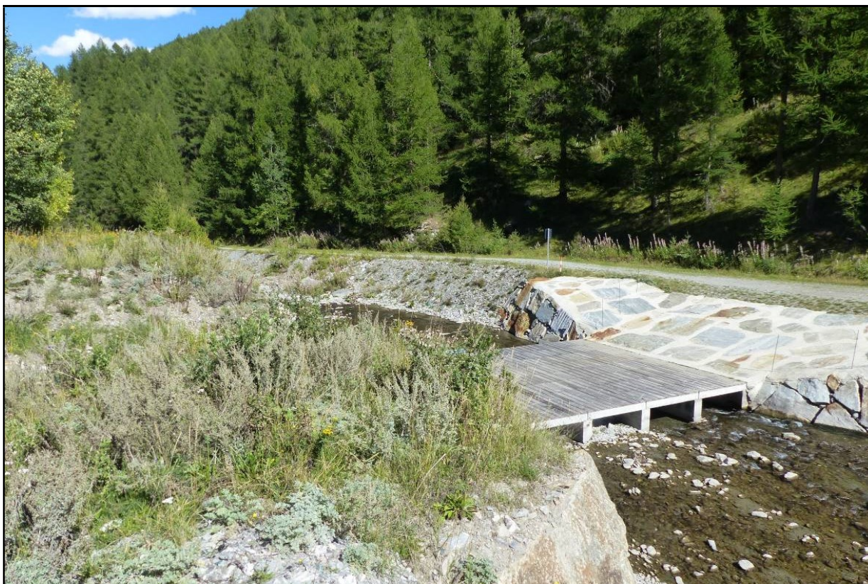
Postazione 4 presso guado esistente