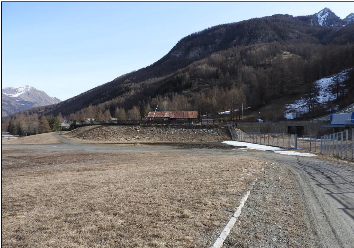
Postazione 3 presso area camper (esterno recinzione)